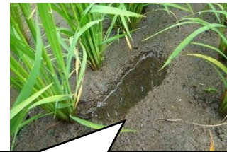
飽水管理 足跡の水を切らさない！